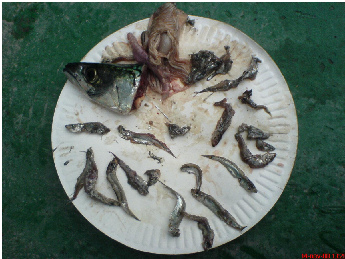
Makrell fanget ved Dragsvik ferjekai, november 2008. Den hadde ca 15-20 brislinger i magen.